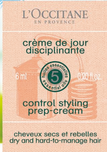
▲ファイブハーブス リベアリングスタイリングクリーム サンプル

明日から、あなたも光りのスタイリング。 いつもの髪型もハーブの輝きで、より美しく。