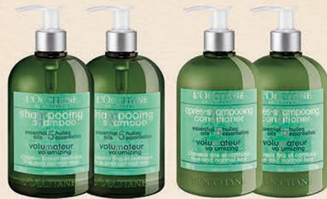
※限定品は数に限りがございます。なくなり次第、終了とさせていただきますのでご注意ください。