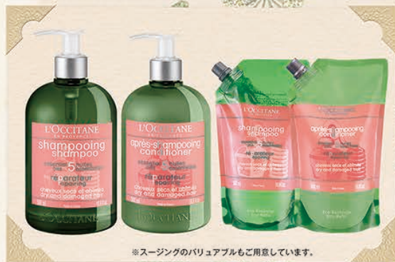
※スーージングのバリュアブルもご用意しています。

※8月15日(水)まで先着でご予約を受け付けております。 なくなり次第、終了とさせていただきますのでご注意ください。