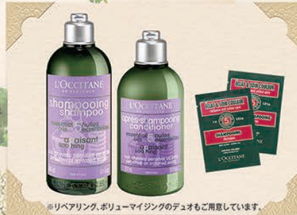
※リペアリング、ボリュマイジングのデュオもご用意しています。