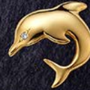
53 ¥30,000 K18ピンブローチ イルカ(ダイヤ1石0.01ct)