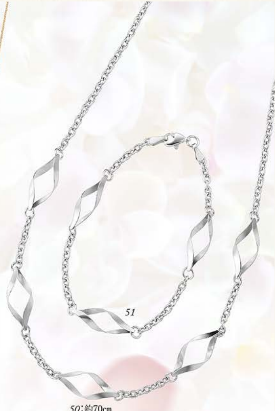
51 ¥42,000 K18WGブレスレット・約18cm