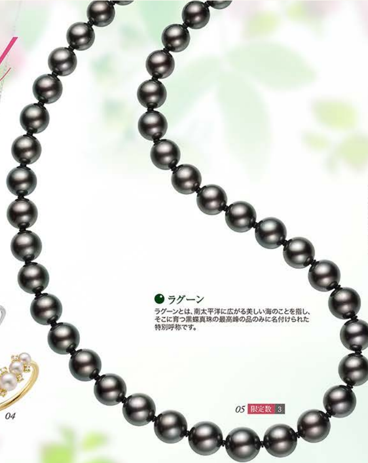
05 限定数 3