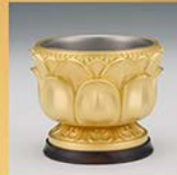
K24 前香が3寸連型 直径約9cm/約60g/ 桐箱/造幣局品位印付