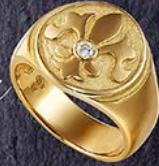
52 ¥198,000 K18リング(ダイヤ1石0.08ct)