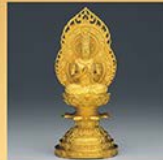
K24 大日如来 10cm/約40g/ 桐箱/造幣局品位印付