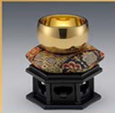
K18 おりん 2.3寸/約170g/りん樽/りん台/ りん布団/桐箱/造幣局品位印付

※掲載商品は一例です。その他の商品や詳細につきましては 会場でご案内いたします。