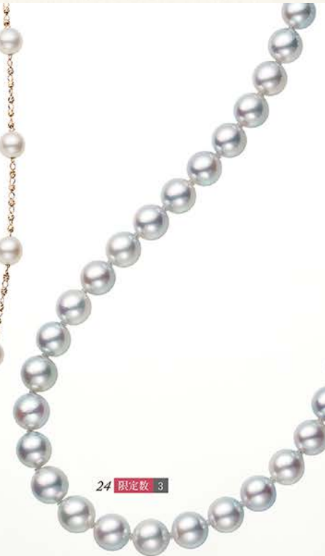
24 限定数 3

P T900アコヤパールリング(径約9.0mm)・ダイヤ 計0.10ct・鑑別書・宇和海産原産地証明書付