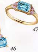
47 ¥48,000 K18ブルートパーズリング0.70ct・アメジスト計 0.04ct・ホワイトトパーズ計0.02ct