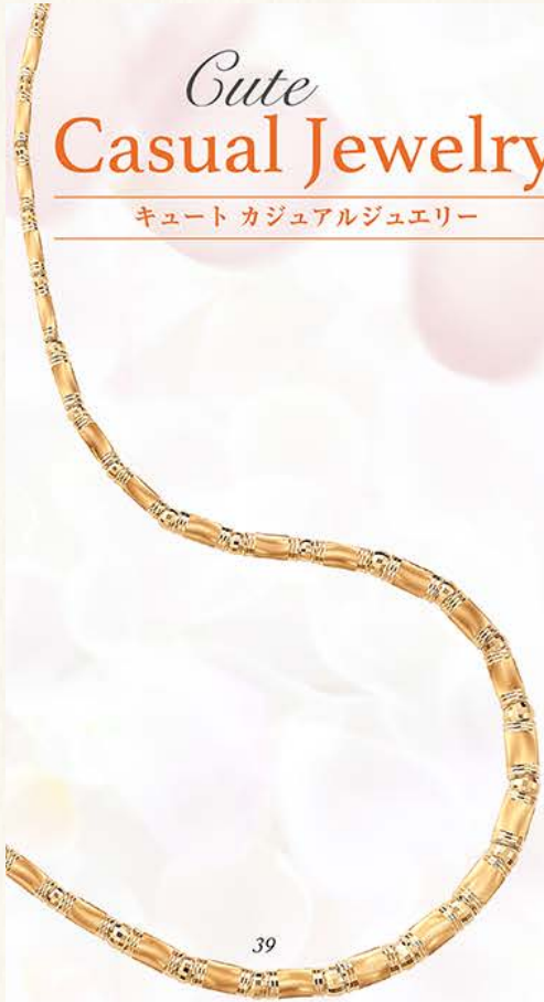
39 ¥148,000 K18ネックレス・約45cm