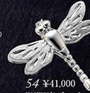
54 ¥41,000 K18WGピンブローチ トンボ