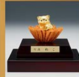
K24 円満ねこ 高さ約25mm/約7g/ ガラスケース/造幣局品位印付