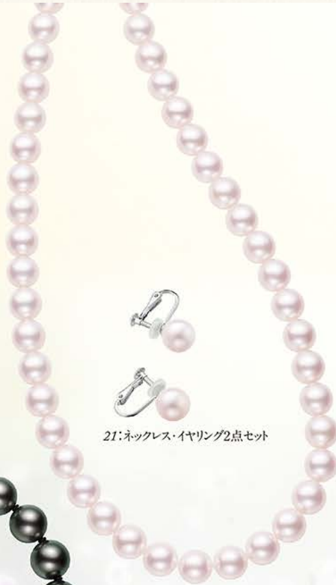
21:ネックレス・イヤリング2点セット