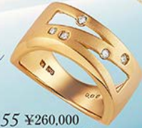
55 ¥260,000 K18ダイヤリング計0.08ct

デザイナーズジュエリー あなたのセンスが光る、ファッショナブルな輝き。 オリジナルデザインの個性的なジュエリーたち。