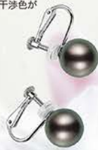
18:ネックレス・イヤリング2点セット

黒蝶パールの中で最高峰とされるカラー。 クジャクの羽のように様々な干渉色が 浮かび上がります。